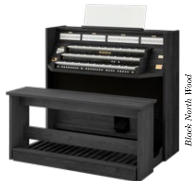
Black North Wood

De Studio 350 is met drie klavieren en 37 stemmen de grotere versie van de Studio 150. De professionele organist heeft met de Studio 350 het perfecte studieorgel in zijn huiskamer staan, maar ook de beginnende hobby-organist beschikt met dit orgel over een rijk palet aan mogelijkheden. Dankzij solostemmen zoals de panfluit en de trompet, kan er volop gevarieerd en geëxperimenteerd worden met uitkomende stemmen.